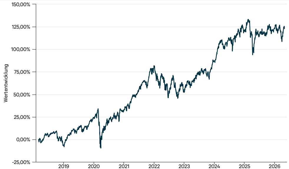
— terrAssisi Aktien I AMI I (a)