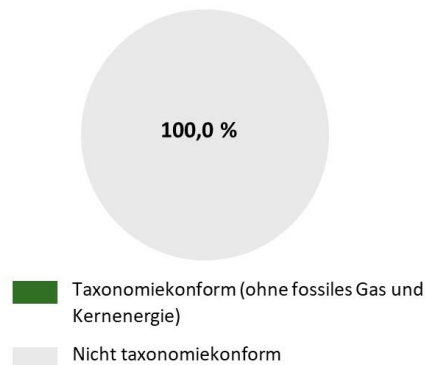
2. Taxonomiekonformität der Investitionen ohne Staatsanleihen*