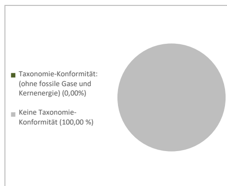
1. Taxonomie-Konformität der Investitionen, darunter Staatsanleihen*