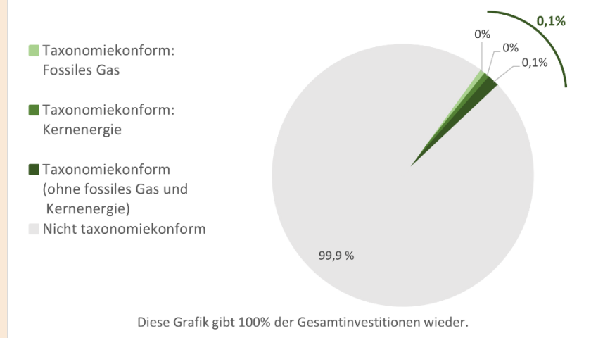
1. Taxonomiekonformität der Investitionen einschließlich Staatsanleihen*

Übergangstätigkeiten sind Tätigkeiten, für die es noch keine CO 2 -armen Alternativen gibt und die unter anderem Treibhausgasemissionswerte aufweisen, die den besten Leistungen entsprechen.